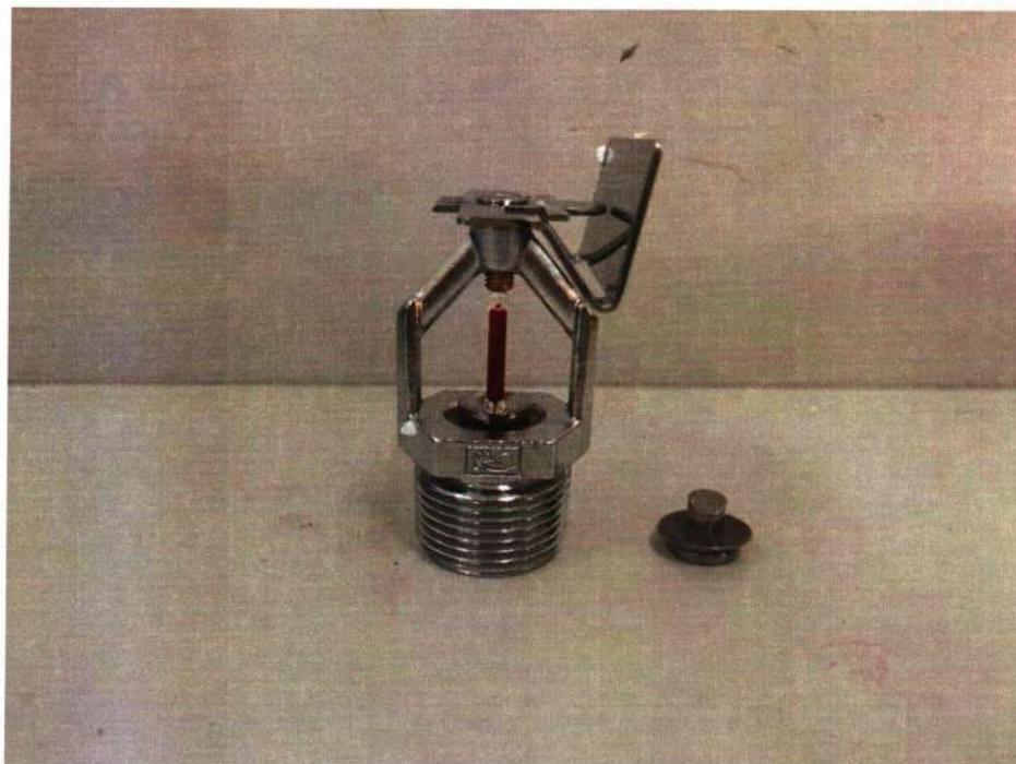
K-ZSTBS 115-68°C Q3