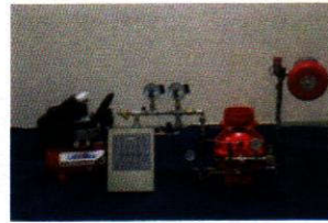
ZSFY 150-1.6 (GC)