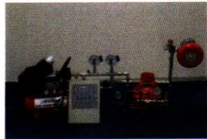
ZSFY 100-1.6 (GC)