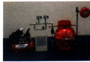
ZSFY 250-1.6 (GC)