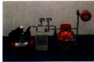
ZSFY 200-1.6 (GC)